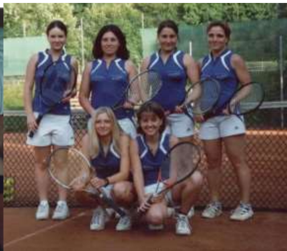
Das zweimal in Folge als Meister aufgestiegene Juniorinnen-Team und die erfolgreichen Damen (links).