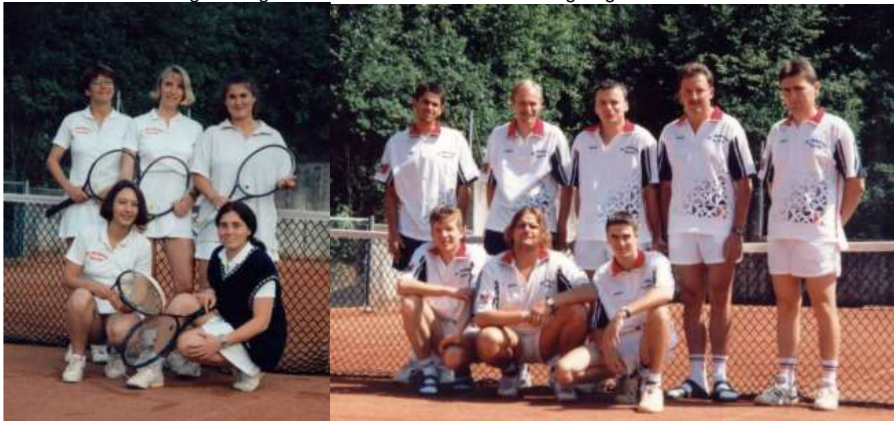
Damen- und Herrenteam 1996